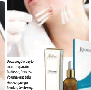
Do zabiegów użyto m.in. preparatu Radiesse, Princess Voluma oraz żelu zuszczającego Ferulac, Sesdermy.